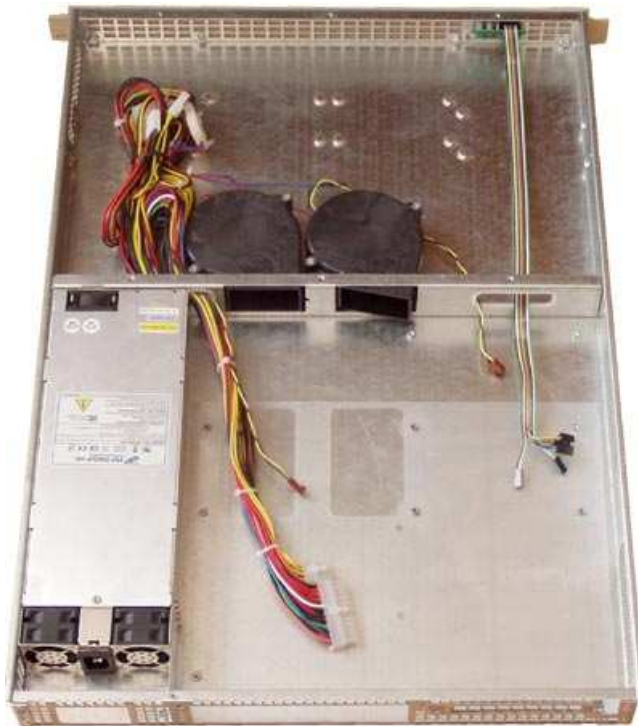
Фото 1. Корпус з установленими передньою панеллю, блоком живлення, вентиляторами

Примітка. Якщо Ви плануєте встановити в корпусі додаткову плату розширення PCI, установіть в PCI слот райзер, а потім закріплюйте материнську плату гвинтами.