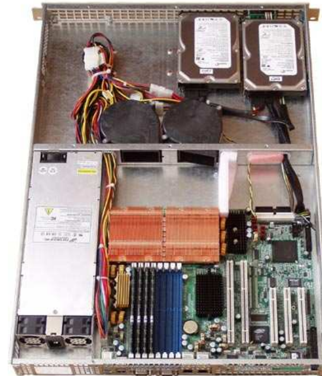
Фото 2. Комп'ютер в корпусі D17

8. Покращення повітряного потоку в корпусі. Для кращого охолодження процесора установіть обмежувальну перегородку, що направить потік повітря від турбін на процесор (процесори) (фото 2).